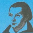
Katharina von Bora