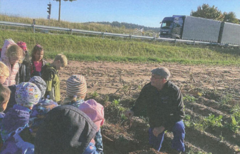
Kita Pustebume - Kartoffelernte