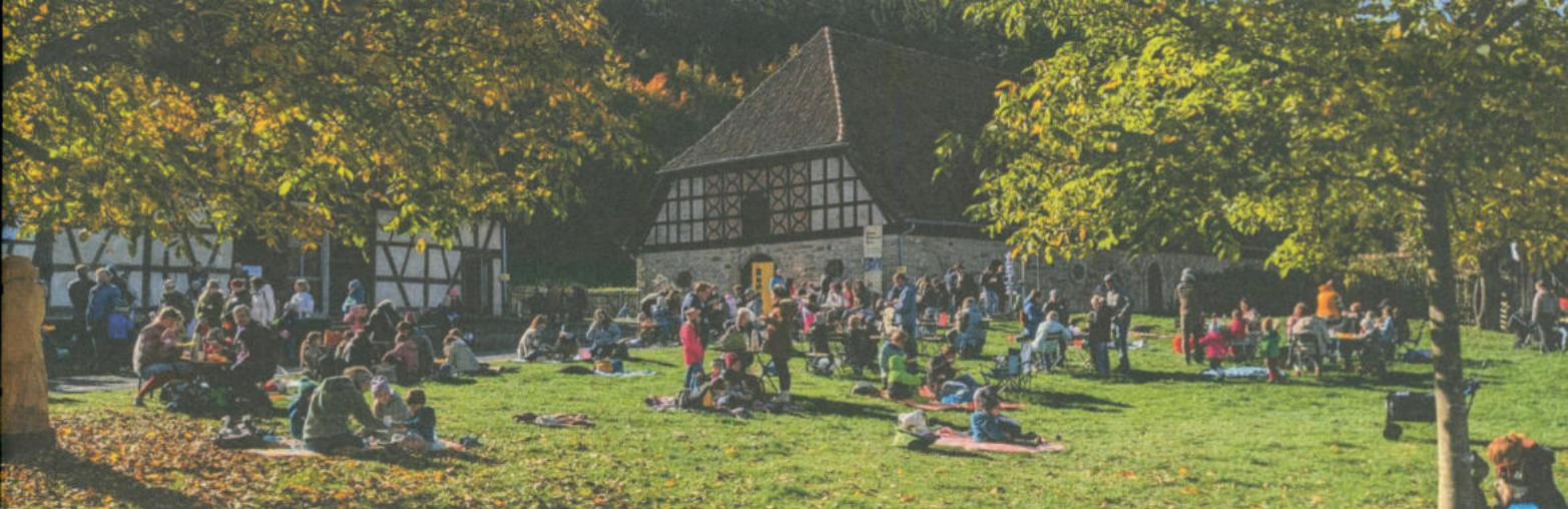
KiKuCo Alte Schäferei am 18. Oktober 2025