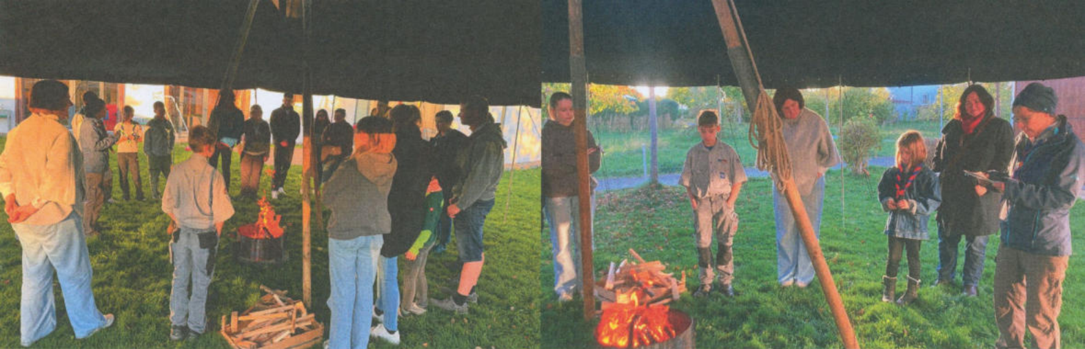
Stammesversammlung des Pfadfinderstammes Albatros