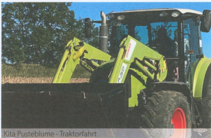
Kita Pustebume - Traktorfahrt