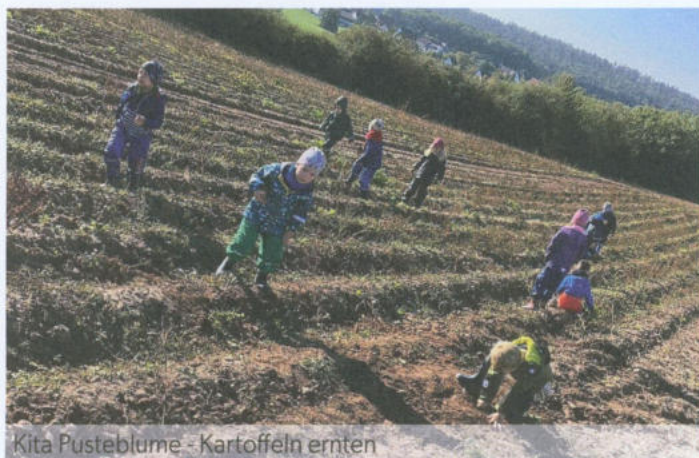
Kita Pustebume - Kartoffeln ernten